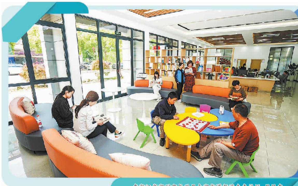
在浙江省湖州市长兴县太湖街道新溪东社区,居民在共享会客厅内进行休闲活动。

社区建设与居民生活息息相关,社区环境的好坏直接影响城镇居民生活体验和质量。近年来,我国大力推进完整居住社区建设,提升了居住社区建设质量、服务水平和管理能力,人民群众获得感、幸福感、安全感得到提升。