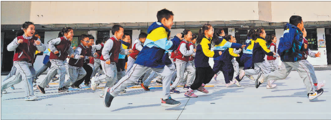
◀上海市浦东新区周浦小学,学生在参加课外活动。丰富多彩的校园生活,让孩子们快乐成长。