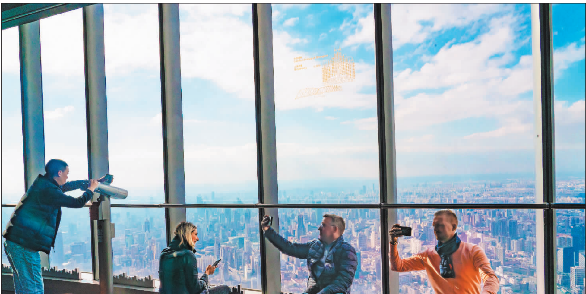
▼上海中心118层观光厅,外国游客在拍照记录上海日新月异的发展变化。