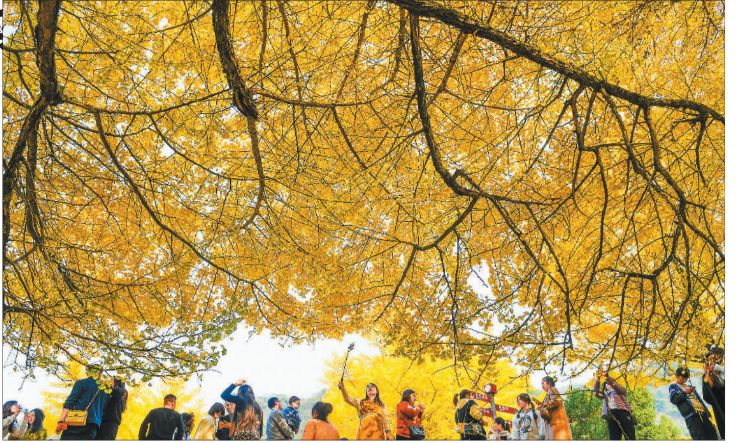
①上海市青西郊野公园冬景如画,吸引了众多游客前来赏景游玩。 ②湖南省双牌县茶林镇桐子坳村游人如织。该村以天下罕见的古银杏群落而闻名,今年成功入选全国最美古树群。 ③江西省上饶市横峰县岑港村的岑港河国家湿地公园,市民在健身游玩。近年来,上饶市扎实开展水土保持工作,减少流域内的水土流失,不断改善水环境。 ④重庆市万盛经开区万东镇方家山森林公园,层林尽染,美不胜收。