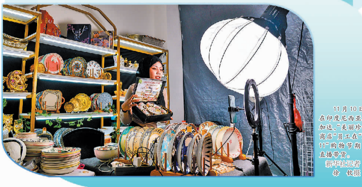
11月10日,在印度尼西亚雅加达,“美丽珍珠商店”员工在“双十一”购物节期间直播带货。