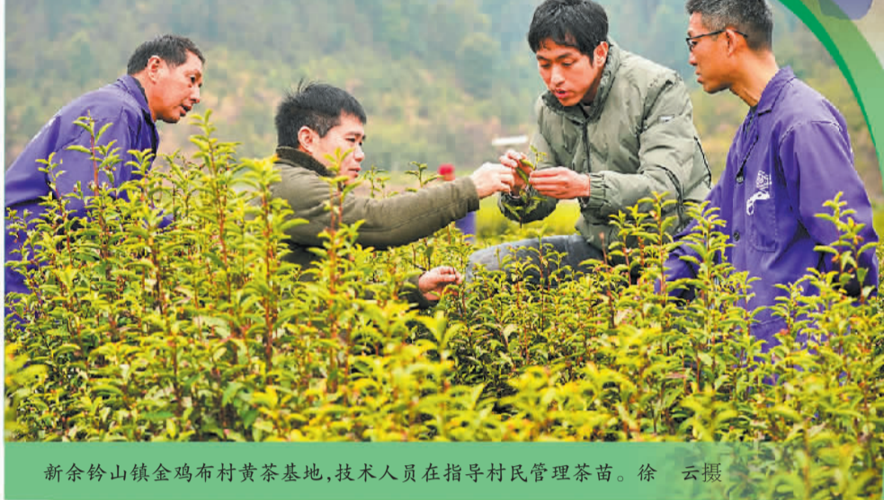
新余铃山镇金鸡布村黄茶基地，技术人员在指导村民管理茶苗。

在新余，像天凯乐这样积极投身乡村振兴的龙头企业还有不少。“产业振兴是乡村振兴的重中之重，也是‘万企兴万村’工作的切入点。”新余市委统战部副部长、市工商联党组书记谢云萍说，近年来，新余各级商会组织注重发挥会员龙头企业优势，推动“万企兴万村”行动走深走实，通过多种形式开展村企联营，不断优化农村产业体系、生产体系、经营体系，提升乡村自我造血能力，促进村集体增收、村民就业，走出了村企共赢的产业振兴之路。