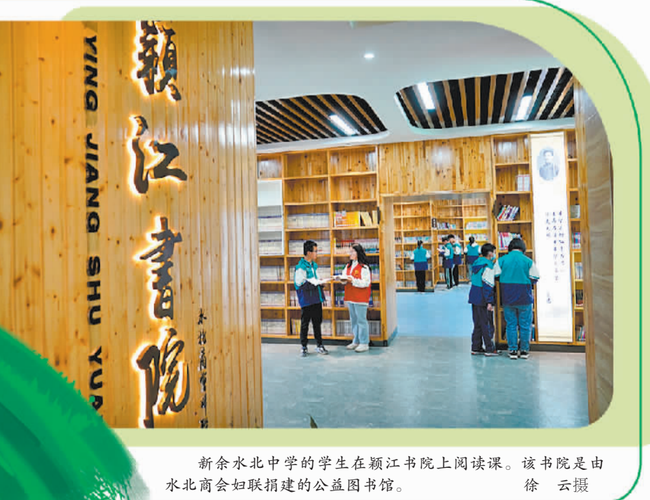
新余水北中学的学生在颖江书院上阅读课。该书院是由水北商会妇联捐建的公益图书馆。