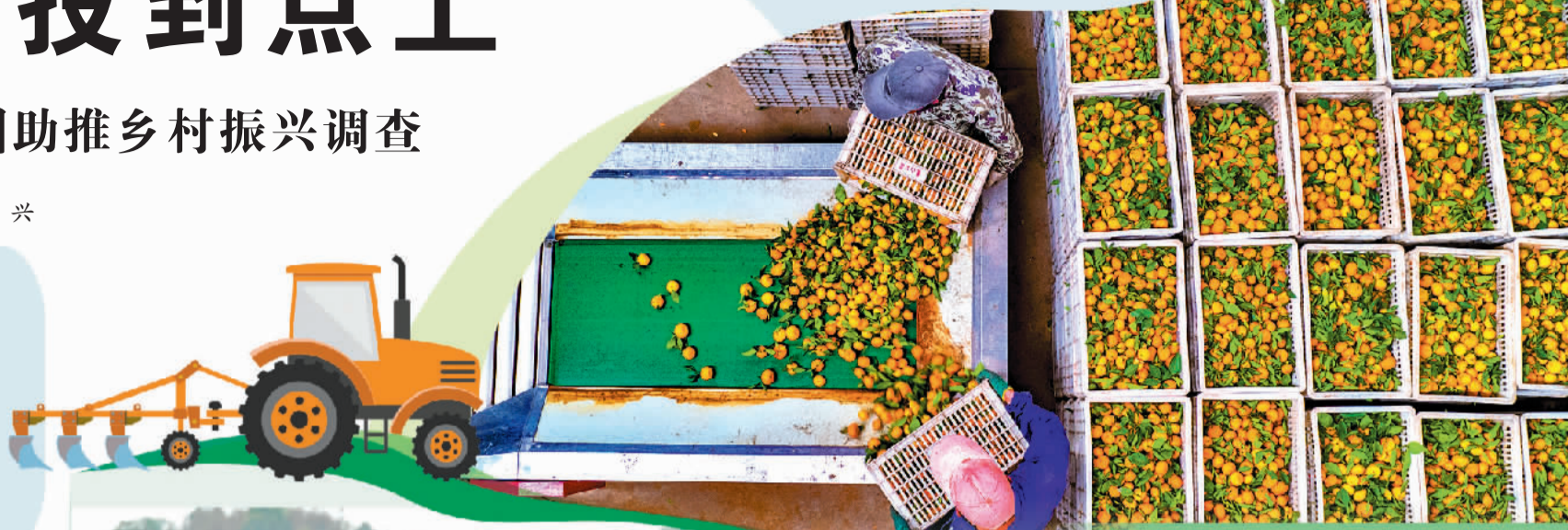
江西新余市南安东洛村果冻橙种植基地，农户拣选果冻橙供应市场。

广袤农村，民企大有可为。民营企业是助力农村发展、推动乡村振兴的一支重要力量。在改善乡村环境、挖掘特色资源、创新经营模式、培育优势产业方面，民营企业具有得天独厚的优势。如何充分发挥这些优势，引导民营企业投资投到点上，更好助推农业农村高质量发展，是各地发展面临的必答题。江西省新余市积极发挥民营企业商（协）会的桥梁纽带作用，大力推进“万企兴万村”行动，探索出一条互惠互利、融合发展的村企共建新路子。