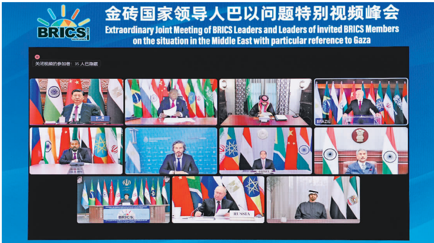
11月21日晚,国家主席习近平出席金砖国家领导人巴以问题特别视频峰会并发表题为《推动停火止战 实现持久和平安全》的重要讲话。