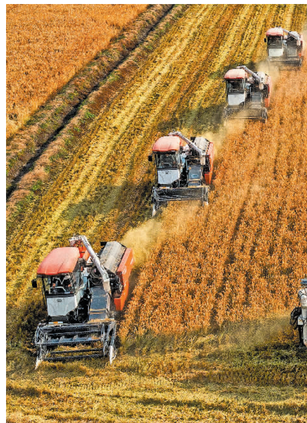
11月16日,江苏省连云港市东海县平明镇安管村,县农发集团所属的高效农田项目区内,大型联合收割机正在紧张收获晚稻。邵光明摄(中经视觉)

文件还明确了行业绿色发展的具体目标,并从实现能源资源高效利用、推进绿色低碳发展两大方面,部署了8项重点任务,提出了相关保障措施。