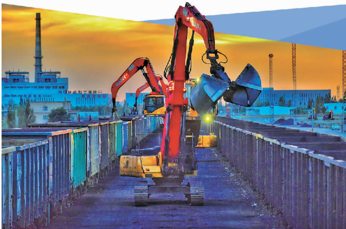
新疆霍尔果斯站换装库换十线抓料机对散堆装货物换装作业。

一连串抢抓机遇的“动作”,是新疆自贸试验区设立带来的新契机。根据方案,新疆自贸试验区的实施范围179.66平方公里,实施范围涵盖乌鲁木齐、喀什、霍尔果斯3个片区。