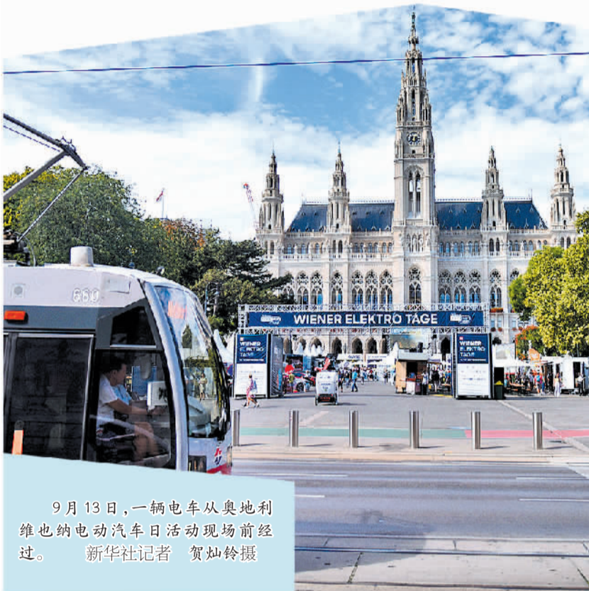
9月13日,一辆电车从奥地利维也纳电动汽车日活动现场前经过。

10月1日起,欧盟碳边境调整机制正式启动。虽然欧盟委员会在出台政策时声称,欧盟碳边境调整机制是一项与世贸组织规则兼容的措施,鼓励全球工业采用更环保、更可持续的技术。但是,单方面提高关税门槛的负面影响显而易见。其一,欧盟绿色保护主义招致广泛批评;其二,企业负担将越来越重;其三,首批六大行业将受到影响。