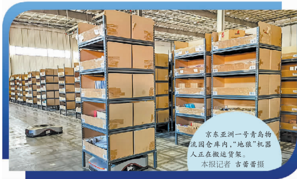
京东亚洲一号青岛物流园仓库内，“地狼”机器人正在搬运货架。

除了运力升级，在旺季前夕，顺丰产品的覆盖面也进一步扩大。凭借独特的多班配送能力和营运模式的创新，“同城半日达”已扩展覆盖200多个城市。这项服务不仅以平均6个小时送达的时效能力深受消费者欢迎，在同城快递领域适用的场景也非常多元。比如，重要场合的礼服、演唱会门票等物品均可以按需送达。以青岛海鲜为例，买家在电商平台下单后，快递小哥会在1小时内