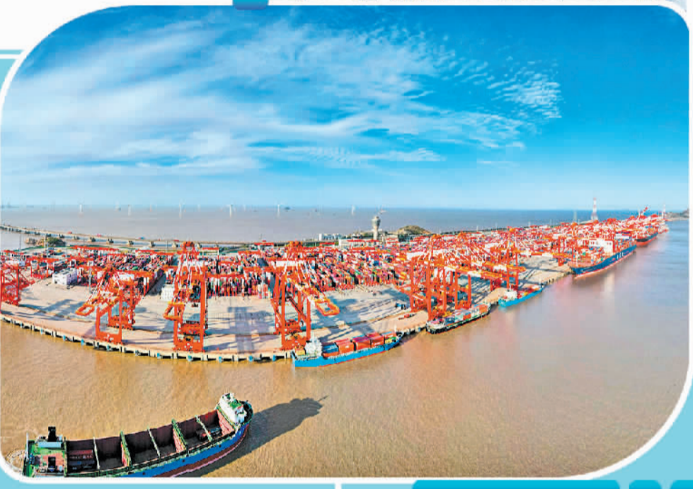
图为中国(上海)自由贸易试验区洋山港四期无人码头。

当前,我国经济逐渐转型,正从传统制造业向创新发展跨越。新兴产业由于自身特性,需要多元化融资策略,因此加快构建新型产业体系和打造高端制造业,亟需提升全球金融资源配置能力和金融服务效率。以上海为例,作为国内领先的国际金融