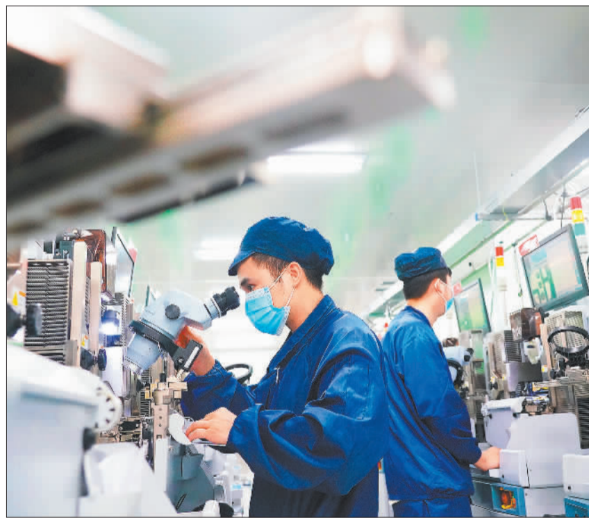
▼盛隆电气智能研发制造产业基地依托数字化智能管理系统，建设了多条智能化生产线，实现产品从制造到智造。