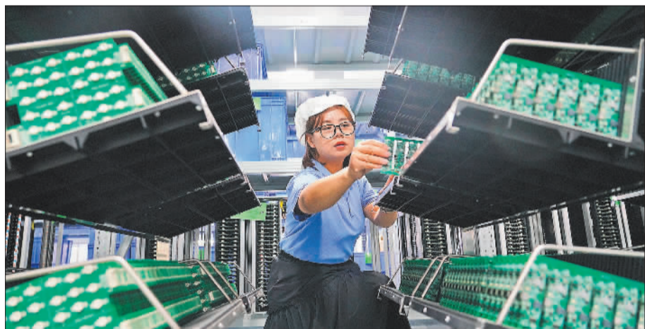
▲益健堂智能穿戴设备产业基地，工作人员在检查可穿戴设备的关键部件。该基地致力建成华中地区最大的智能穿戴设备生产基地，推动大健康等产业集聚发展。