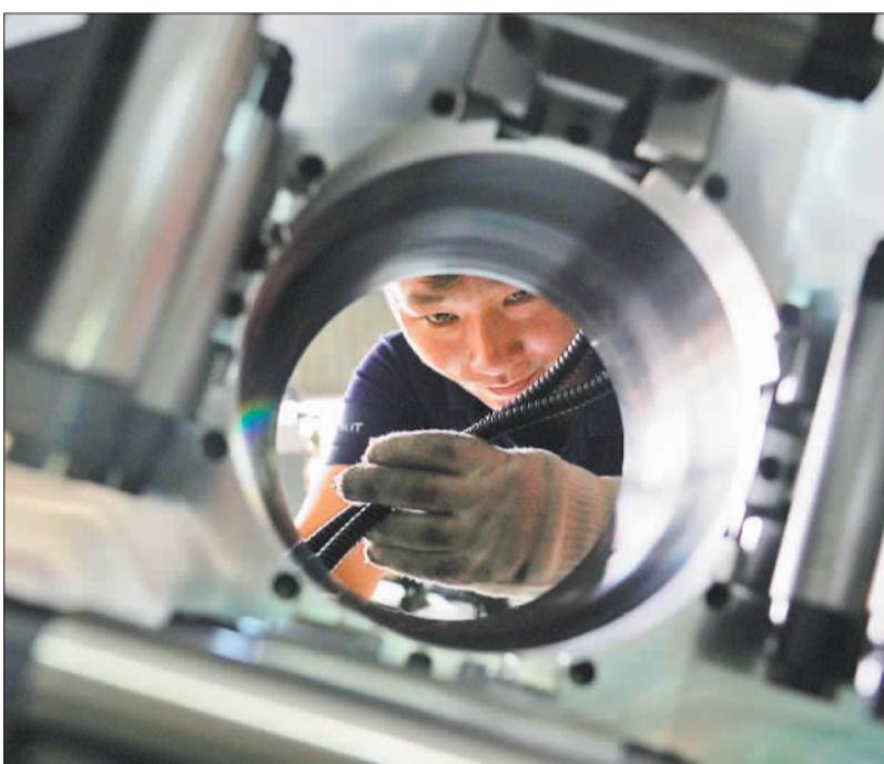
▲位于湖北鄂州葛店经开区的华工法利莱切焊系统工程有限公司，员工在调试设备。该公司技术实力处于中国激光技术研究及应用领域最前沿。