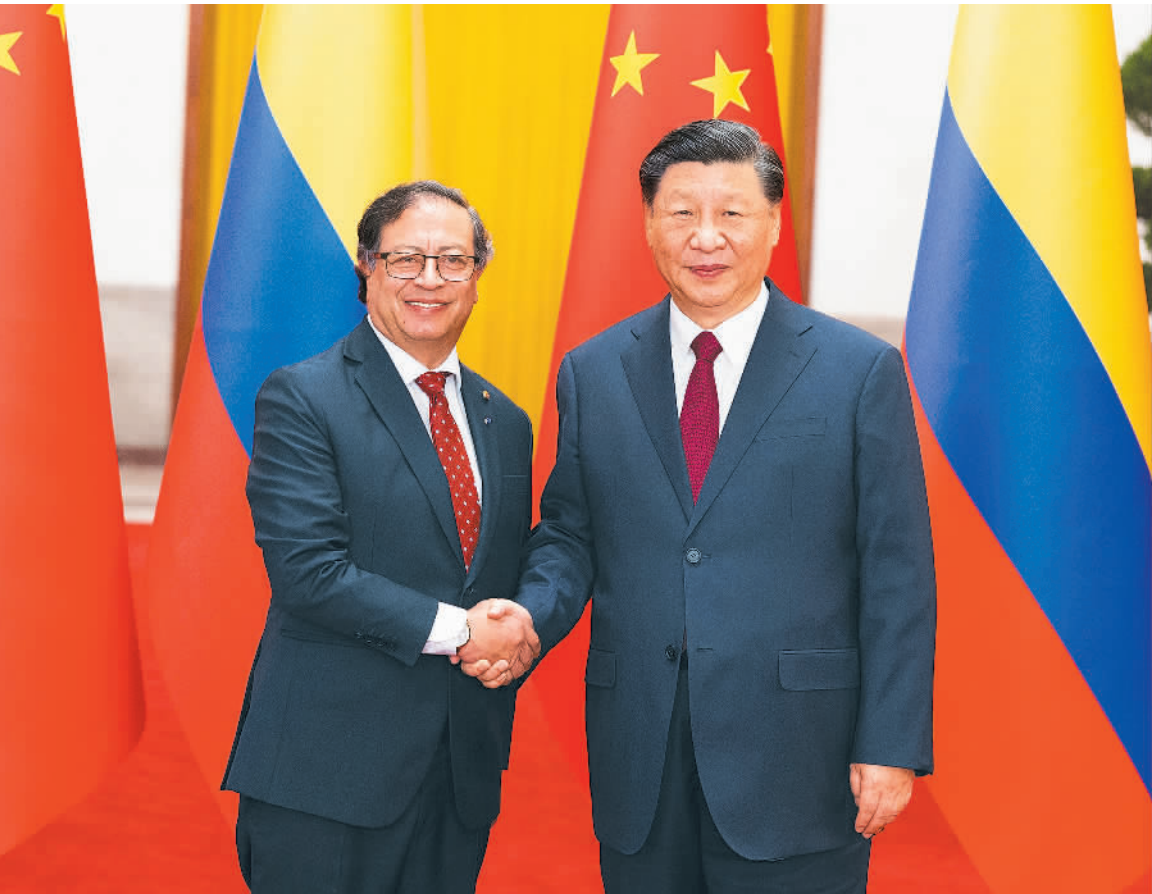
哥伦比亚总统佩特罗举行会谈 十月二十五日下午