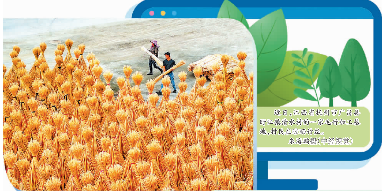
近日，江西省抚州市广昌县盱江镇清水村的一家毛竹加工基地，村民在晾晒竹丝。

苏祖云表示，当前林业产业亟待解决的问题可归纳为思想认识、竞争能力和扶持力度三个方面。林业产业是绿色产业，是绿水青山转化为金山银山的重要途径和载体，但是，一些地方和部门对“两山”理念的领会不够深入，对