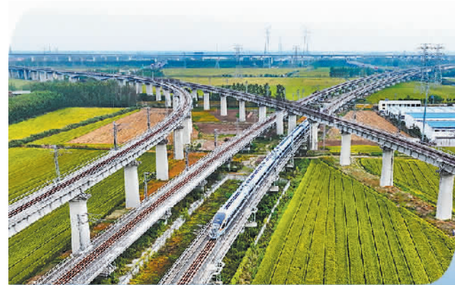
一列动车组列车行驶在江苏连云港市境内。

中国国家铁路集团有限公司(下称“国铁集团”)发布最新数据显示，三季度，全国铁路发送旅客11.5亿人次，较2019年同期增长11.6%，9月22日铁路12306售票2695.2万张，9月29日发送旅客2009.8万人次，单日售票量、单日旅客发送量均创历史新高，铁路运输安全和秩序良好。