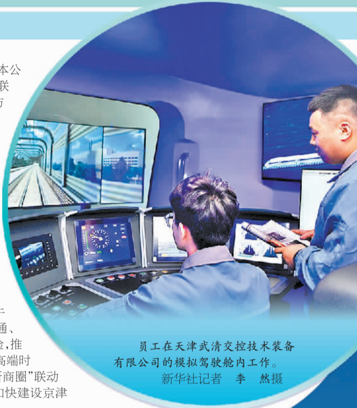
员工在天津武清交控技术装备有限公司的模拟驾驶舱内工作。