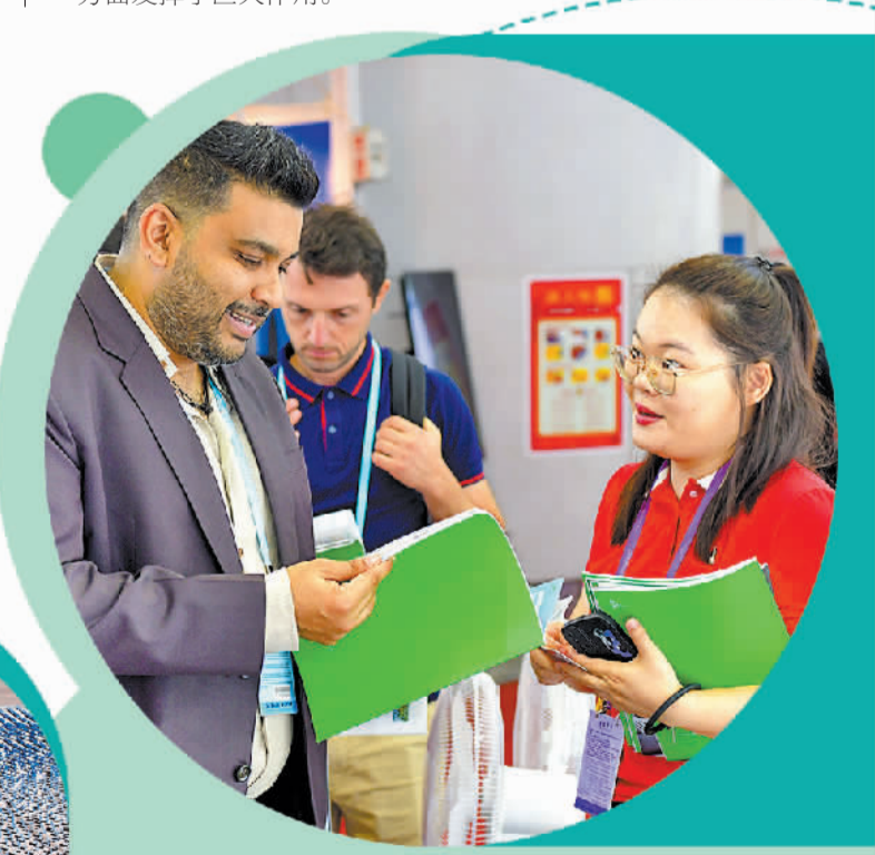
上图 10月15日,阿联酋客商在广交会上参观、洽谈。