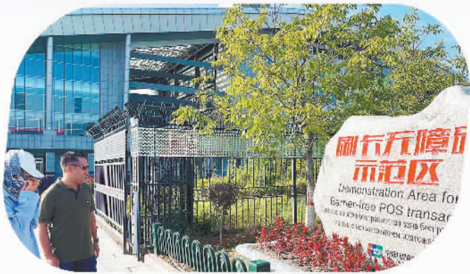
位于中哈霍尔果斯国际边境合作中心的“银行卡刷卡无障碍示范区”