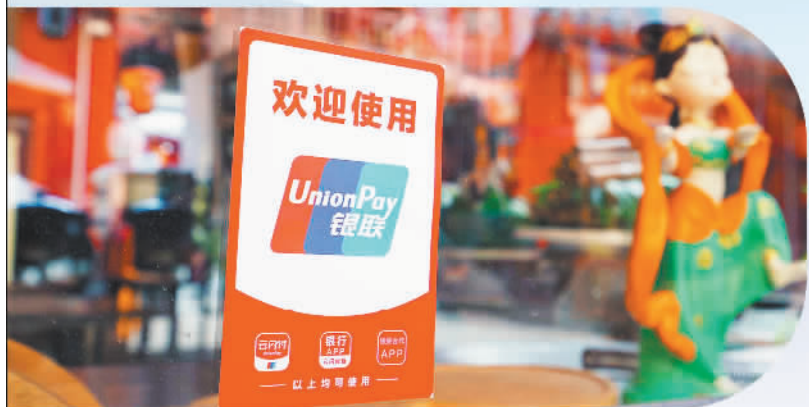
游客可在敦煌的沙洲夜市便捷使用云闪付APP