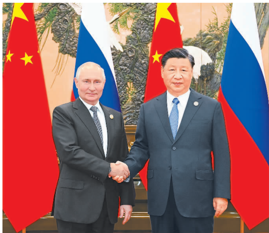
10月18日中午,国家主席习近平在北京人民大会堂同来华出席第三届“一带一路”国际合作高峰论坛的俄罗斯总统普京举行会谈。

新华社北京10月18日电(记者杨依军、罗鑫)10月18日中午,国家主席习近平在人民大会堂同来华出席第三届“一带一路”国际合作高峰论坛的俄罗斯总统普京举行会谈。 习近平指出,普京总统连续3次出席“一带一路”国际合作高峰论坛,体现了俄方对共建“一带一路”倡议的支持。俄罗斯是中国开展共建“一带一路”国际合作的重要伙伴。中俄东线天然气管道等重大基础设施项目投入运营,为两国人民带来了实实在在的好处。中方愿同俄方及欧亚经济联盟各国一道,推动共建“一带一路”与欧亚经济联盟对接,开展更高水平、更深层次的区域合作,希望中蒙俄天然气管道项目尽早取得实质性进展,开展好“万里茶道”跨境旅游合作,把中蒙俄经济走廊打造成一条高质量联通发展之路。 习近平强调,发展永远睦邻友好、全面战略协作、互利合作共赢的中俄关系不是权宜之策,而是长远之计。明年是中俄建交75周年。中方愿同俄方一道,准确把握历史大势,立足两国人民根本利益,不断充实双方合作的内涵。中方支持俄罗斯人民走自主选择的民族复兴道路,维护国家主权、安全、发展利益。双方要推动中俄务实合作高质量发展,积极开拓战略性新兴产业合作,以2024—2025年中俄文化年为契机,举办更多丰富多彩的文化交流活动。