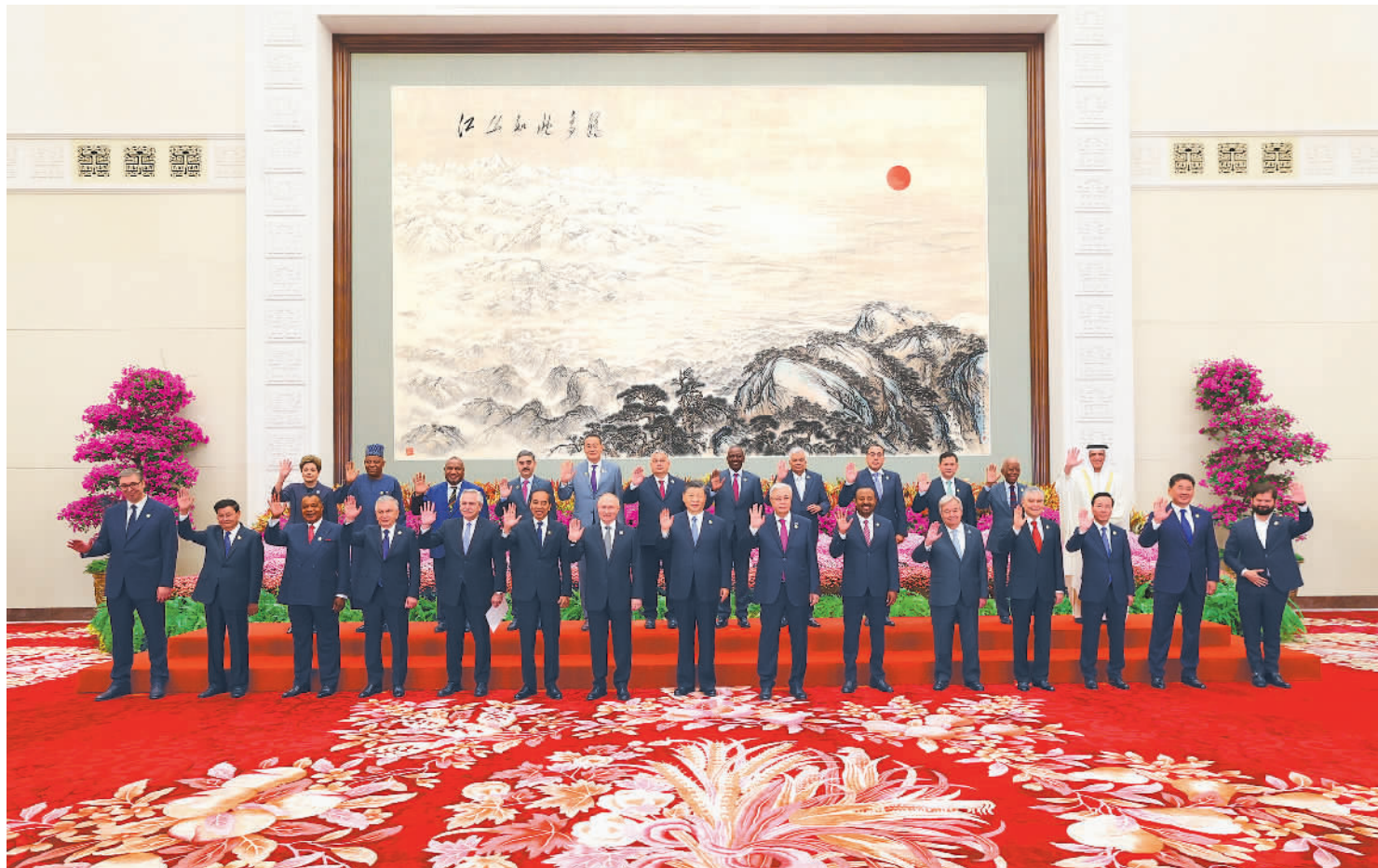
10月18日上午,国家主席习近平在北京人民大会堂出席第三届“一带一路”国际合作高峰论坛开幕式并发表题为《建设开放包容、互联互通、共同发展的世界》的主旨演讲。