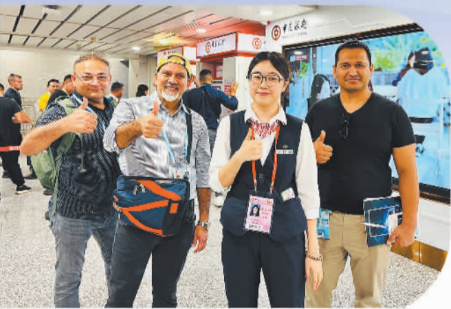
中国银行广东省分行全方位服务第134届广交会

中国银行凭借在国际资本市场及境外业务领域的优势,不断促进共建“一带一路”国家间的资金融通、贸易畅通、民心相通。深耕南粤百年,广东中行深刻领悟金融工作的政治性、人民性,始终处于支持共建“一带一路”的第一方阵。今年4月,中国银行与广东省签订战略合作协议,协议期内将提供等值人民币3万亿元的意向性金融支持,支持广东省重点产业集群发展及重大项目建设。