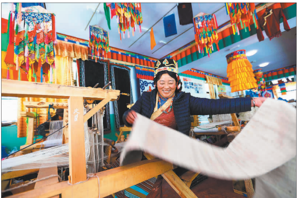
▼氉氉是一种藏族羊毛纺织工艺制品,拥有2000多年历史。在拉萨,很多妇女都会氉氉编织技艺。