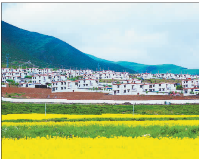
▶拉萨市墨竹工卡县甲玛乡孜孜荣村景如画。当地统筹城乡发展,乡村面貌发生可喜变化。