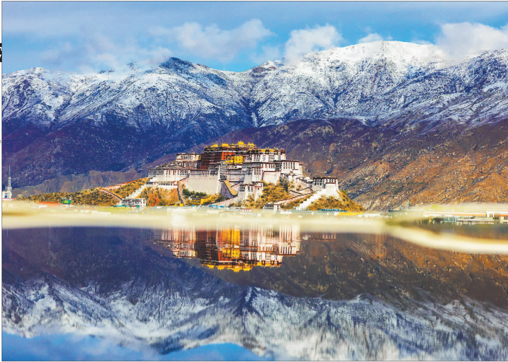
◀西藏布达拉宫美景。始建于7世纪的布达拉宫,是第一批全国重点文物保护单位,也是世界文化遗产。