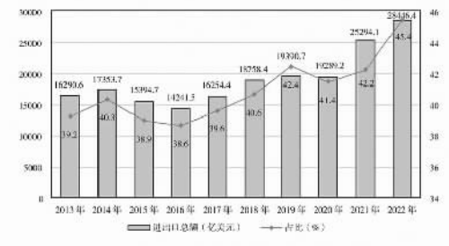
图2 2013—2022年中国与共建国家进出口总额及其占中国外贸总值比重

贸易投资规模稳步扩大。2013—2022年,中国与共建国家进出口总额累计19.1万亿美元,年均增长6.4%;与共建国家双向投资累计超过3800亿美元,其中中国对外直接投资超过2400亿美元;中国在共建国家承包工程新签合同额、完成营业额累计分别达到2万亿美元、1.3万亿美元。2022年,中国与共建国家进出口总额近2.9万亿美元,占同期中国外贸总值的45.4%,较2013年提高了6.2个百分点;中国民营企业对共建国家进出口总额超过1.5万亿美元,占同期中国与共建国家进出口总额的53.7%。