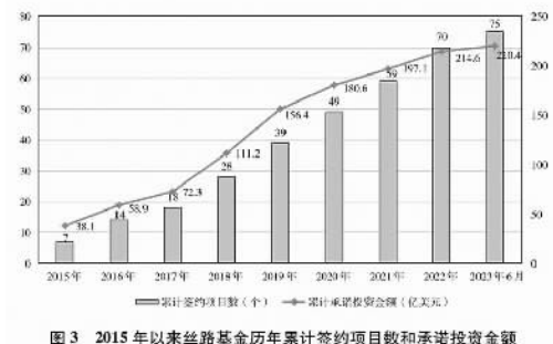
图3 2015年以来丝路基金历年累计签约项目数和承诺投资金额

投融资渠道平台不断拓展。中国出资设立丝路基金,并与相关国家一道成立亚洲基础设施投资银行。丝路基金专门服务于“一带一路”建设,截至2023年6月底,丝路基金累计签约投资项目75个,承诺投资总额220.4亿美元;亚洲基础设施投资银行已有106个成员,批准227个投资项目,共投资436亿美元,项目涉及交通、能源、公共卫生等领域,为共建国家基础设施互联互通和经济社会可持续发展提供投融资支持。中国积极参与各类融资安排机制,与世界银行、亚洲开发银行等国际金融机构签署合作备忘录,与国际金融机构联合筹建多边开发融资合作中心,与欧洲复兴开发银行加强三方市场投融资合作,与国际金融公司、非洲开发银行等开展联合融资,有效撬动市场资金参与。中国发起设立中国—欧亚经济合作基金、中拉合作基金、中国—中东欧投资合作基金、中国—东盟投资合作基金、中拉产能合作投资基金、中非产能合作基金等国际经济合作基金,有效拓展了共建国家投融资渠道。中国国家开发银行、中国进出口银行分别设立“一带一路”专项贷款,集中资源加大对共建“一带一路”的融资支持。截至2022年底,中国国家开发银行已直接为1300多个“一带一路”项目提供了优质金融服务,有效发挥了开发性金融引领、汇聚境内外各类资金共同参与共建“一带一路”的融资先导作用;中国进出口银行“一带一路”贷款余额达2.2万亿元,覆盖超过130个共建国家,贷款项目累计拉动投资4000多亿美元,带动贸易超过2万亿美元。中国信保充分发挥出口信用保险政策性职能,积极为共建“一带一路”提供综合保障。