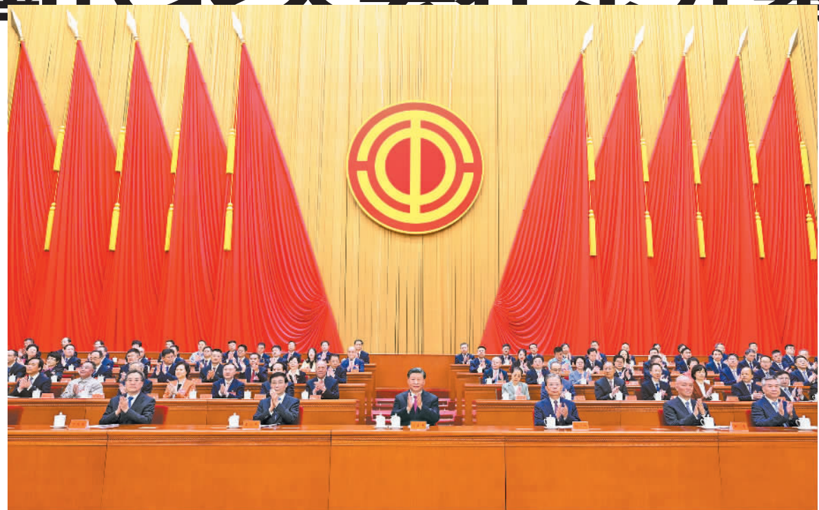
10月9日，中国工会第十八次全国代表大会在北京人民大会堂开幕。习近平、赵乐际、王沪宁、蔡奇、丁薛祥、李希等在主席台就座，祝贺大会召开。

新华社北京10月9日电 中国工会第十八次全国代表大会9日上午在人民大会堂开幕。中共中央总书记、国家主席、中央军委主席习近平在主席台上方悬挂着“中国工会第十八次全国代表大会”的会标，后幕正中象征着中国工会和中国工人阶级团结统一的工会会徽熠熠生辉，10面红旗分列两侧。二楼眺台悬挂着“坚持以习近平新时代中国特色社会主义思想为指导，全面贯彻党的二十大精神，组织动员亿万职工为全面建设社会主义现代化国家、全面推进中华民族伟大复兴团结奋斗！”的巨型横幅。