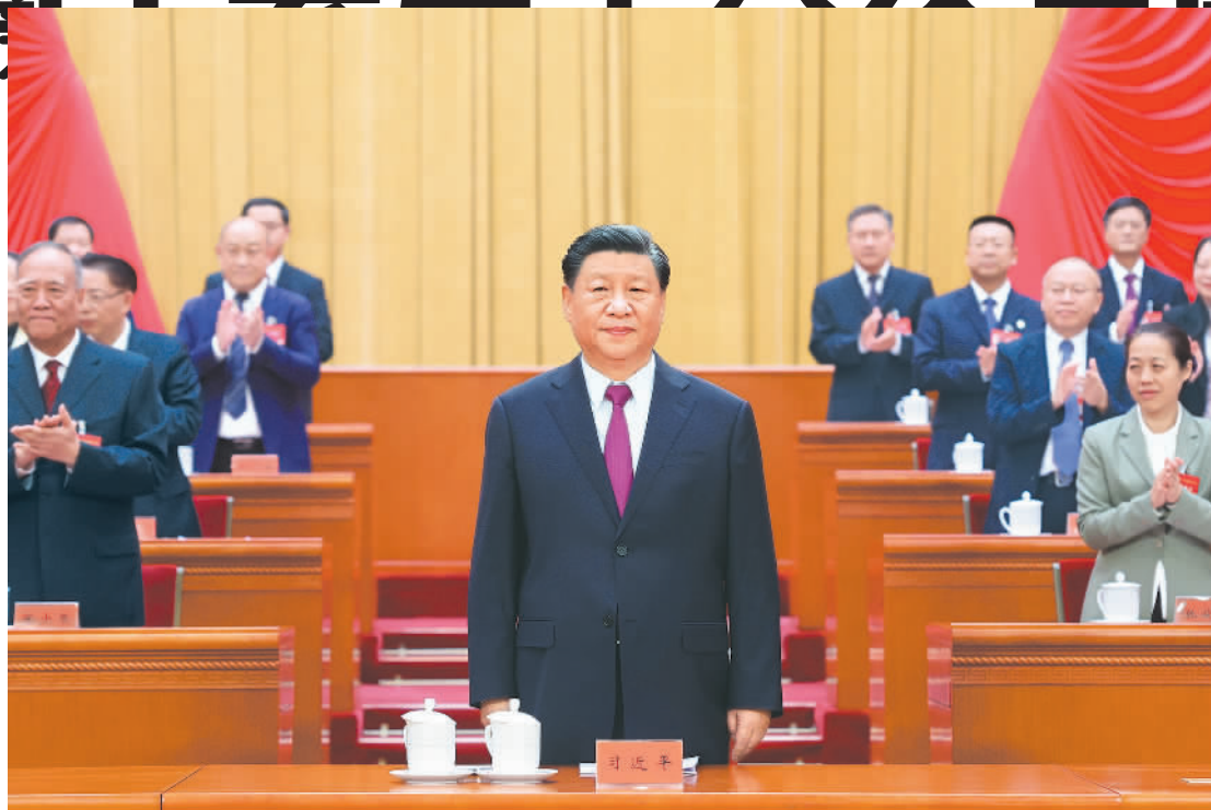
10月9日，中国工会第十八次全国代表大会在北京人民大会堂开幕。这是中共中央总书记、国家主席、中央军委主席习近平在主席台向与会代表致意。