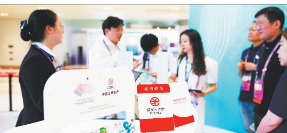
▼作为杭州第19届亚运会官方合作伙伴和数字人民币指定运营机构，工商银行浙江分行打造了一系列数字人民币消费新场景。