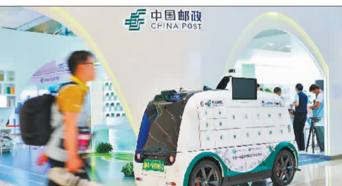
▲杭州亚运会主媒体中心，中国邮政展出的无人投递车。