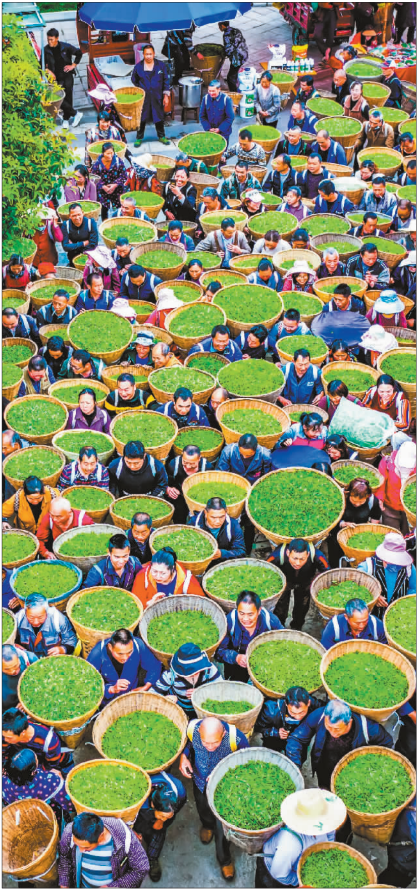
▲四川省雅安市春茶早市上,茶农背着采摘的茶叶排队等待销售。该市各大茶区的茶叶交易市场,产销两旺。

合作社、龙头企业培育壮大3年计划,年内新培育省级示范场社600个、农业产业化联合体50个以上,逐步把小农户融入现代农业;以园区集群为载体,强力推动农业全产业链条升级,建设7个国家级、30个省级产业集群。推动川种振兴,组建天府种业实验室,做实生产供应链。