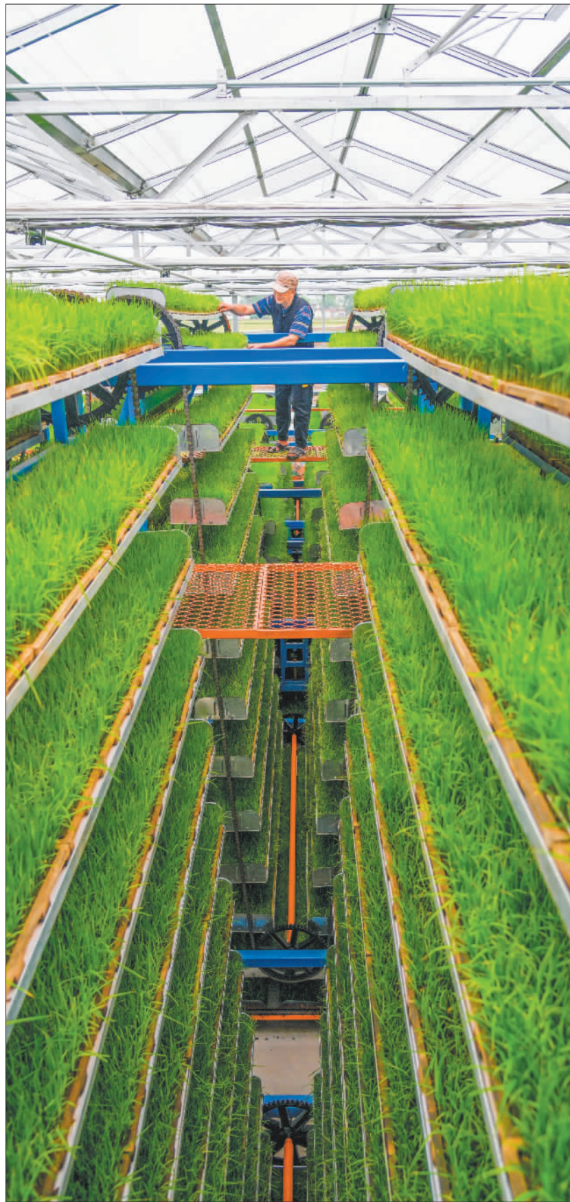
►眉山市彭山区的一家智能化集成育秧工厂。育秧不仅节约了成本,更是大幅度提高了水稻生产全程机械化水平。