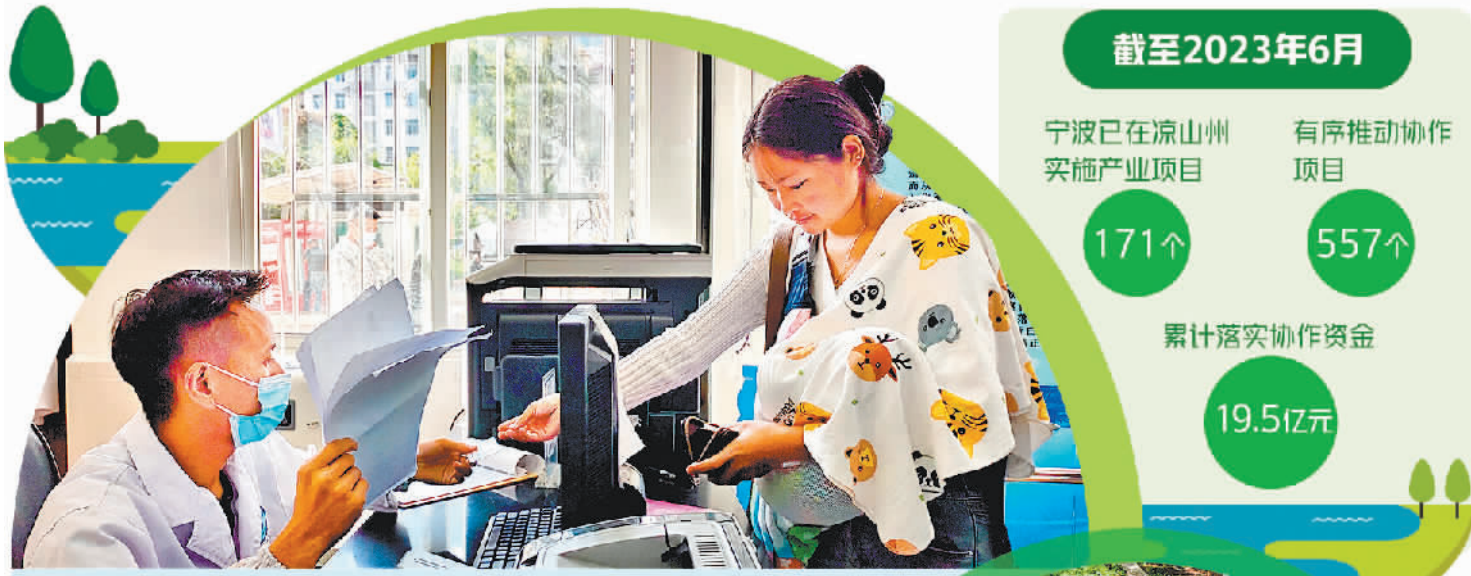
图为当地群众在凉山州美姑县人民医院就医。

一期投资1000万元的三乐灵芝产业园是宁波市象山县在四川省雷波县的援建项目之一。根据中央统一部署,新一轮东西部协作浙江全面结对帮扶四川,宁波市全面结对帮扶凉山彝族自治州。两年多来,宁波市针对凉山州的帮扶涉及产业、劳务及消费、民生等多个方面。截至2023年6月,宁波已累计落实协作资金19.5亿元,有序推动协作项目557个。两地政府部门通力协作,帮助凉山州守住不发生规模性返贫这条底线,不断巩固拓展脱贫攻坚成果,为乡村振兴赋能蓄力。