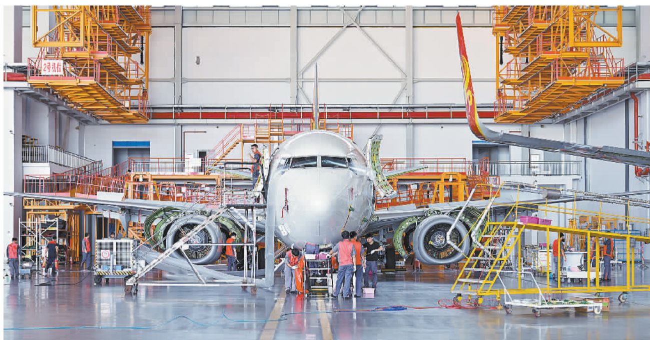
9月19日,在海南省海口空港综合保税区一站式飞机维修基地,工作人员正在为飞机进行定检维修。据海关统计,截至今年8月底,海口空港综合保税区保税维修进出口值累计达46.6亿元。