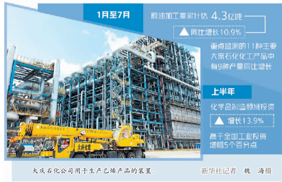
大庆石化公司用于生产乙烯产品的装置。

近日,工业和信息化部、国家发展改革委、财政部等7部门联合印发《石化化工行业稳增长工作方案》,确定了石化化工行业稳增长的主要目标,提出了扩大有效投资、丰富优质供给、稳定外贸外贸、强化要素供给、激发企业活力5项主要工作举措,并配套保障措施。《方案》的发布实施将为推动石化化工行业平稳运行、实现高质量发展奠定坚实基础,为国民经济平稳健康发展提供有力支撑。