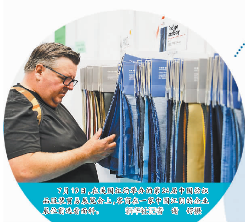
7月19日,在美国纽约举办的第24届中国纺织品服装贸易展会上,客商在一家中国江门的展位前查看面料。

同时,全球数字服务贸易、环境商品贸易和全球价值链等领域也处于扩张之中。2022年,全球服务贸易额为6.8万亿美元,同比增长15%。全球贸易数字化进程飞速发展。2019年至2022年,全球数字服务贸易增长了36.9%。