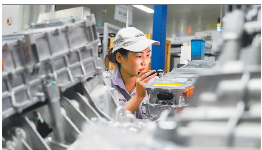
▼智新科技电驱工厂装配车间作业人员进行总成下线检查。智新科技是东风公司从事电控、电机、电池、智能域控产品研发的重要企业,现已形成“1+3”事业布局,打造行业领先动力总成。