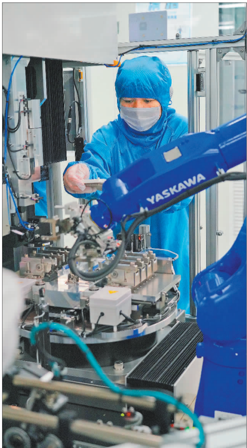
▲智新半导体自动化封测产线,员工在半导体端子焊接工序进行设备调试。智新半导体研发的车规级IGBT模块,为新能源车装上“智慧大脑”。