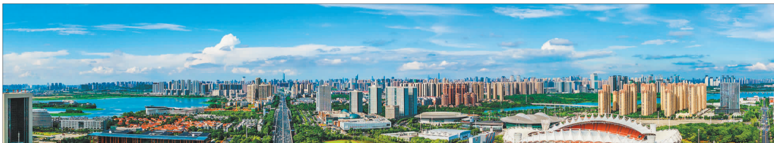
▲全长13公里的东风大道,沿线集聚德国采埃孚、法国艾菲等汽车及零部件工厂和东风本田全球新能源标杆工厂、猛士科技等新能源工厂,是中部地区规模最大的制造业集聚区。

“在奔跑中调整呼吸,在超车中变换赛道。”武汉经开区相关负责人介绍,中国车谷正锚定“二次创业再出发”的目标,奋力打造车谷产业创新大走廊,力争下一代汽车新赛道上进入全国第一方阵。