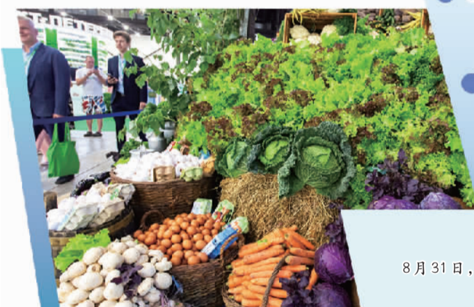
8月31日,参观者在俄罗斯圣彼得堡第32届国际农业工业展农产品展区参观。