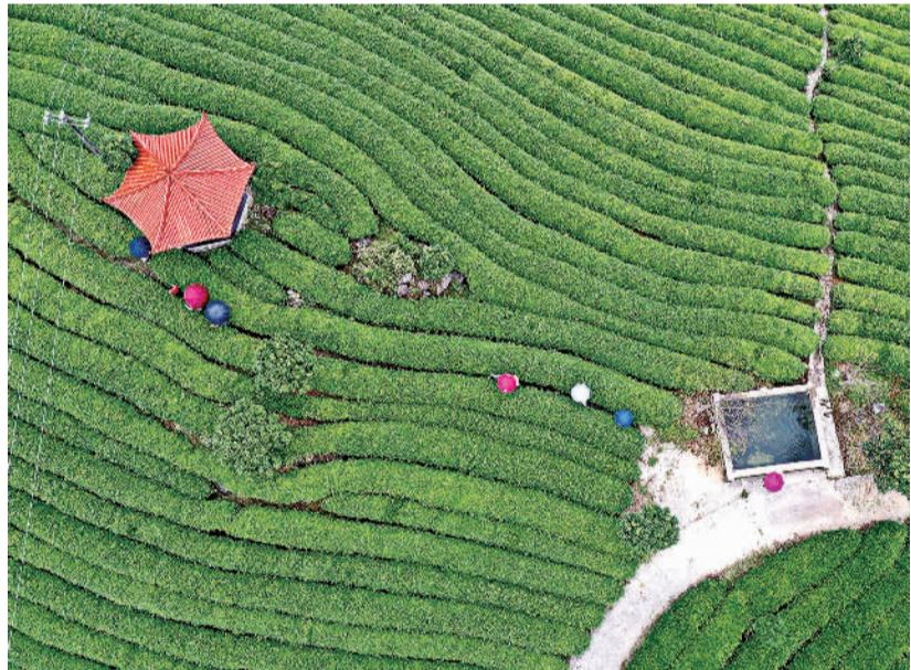
9月2日，游客在福建省宁德市古田县凤埔龙山生态茶园参观游览。近年来，古田县因地制宜发展高山有机茶产业，将茶叶产业和生态旅游紧密结合，用好用活政策资源，大力发展观光农业，带动群众增收致富，走出一条茶旅融合发展的乡村振兴路子。