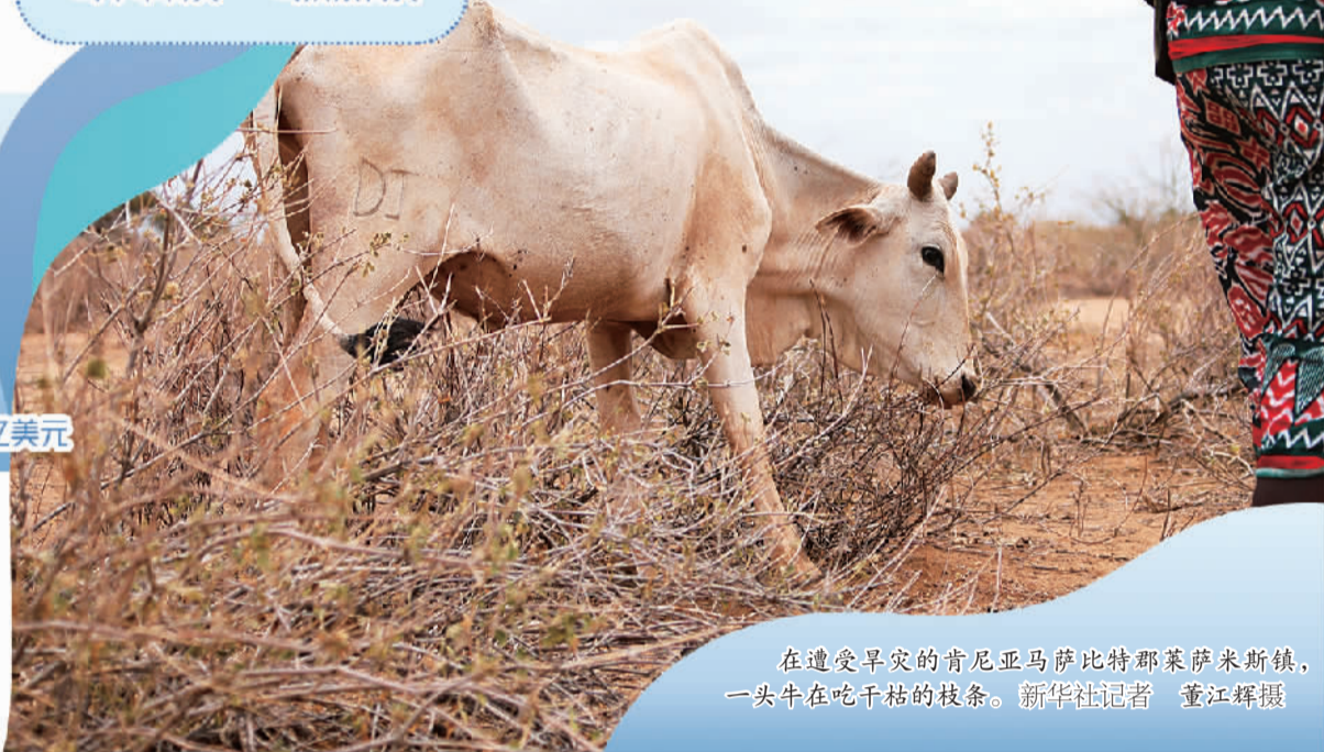
在遭受旱灾的肯尼亚马萨比特郡莱萨米斯镇,一头牛在吃干枯的枝条。

示,气候变化给非洲造成的损失和损害成本预计达到2900亿美元至4400亿美元。受气候变暖引起的不同程度影响,相关损失和损害成本也会相应变化。此外,气候变化及其造成的自然资源不断减少还可能引发争夺生产性土地、水和牧场的冲突。过去10年,由于争夺土地资源的压力不断增加,撒哈拉以南非洲国家农牧民暴力事件有所增多。