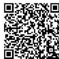
视频报道请扫二维码