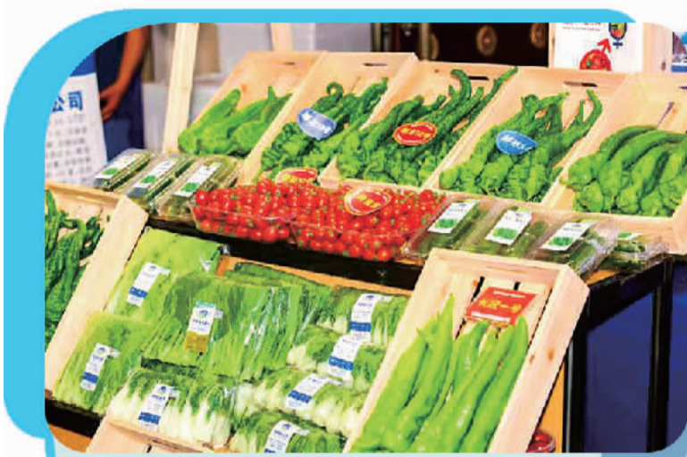
宁夏固原市冷凉蔬菜节上展示的六盘山果蔬产品。

公司2020年在这里流转1000亩土地，种植有机蔬菜20多个品种。按照“公司+基地+农户”的生产模式，培育全产业链，实现产品全程质量追溯，带动周边群众150余人务工，每月人均收入3000元以上。同时，还带动红河、宽坪、上王等村大力发展蔬菜产业，形成了设施农业示范带，年产值突破1亿元。”