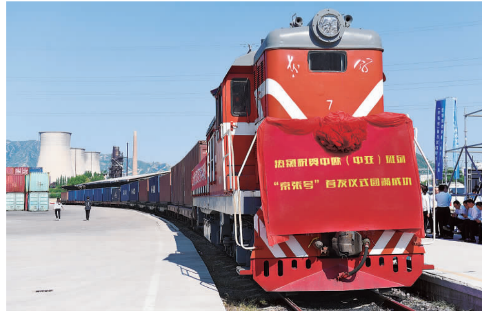
8月29日上午10点，首列满载汽配、家电、纺织品、电梯设备等物资的中欧(中亚)班列“京张号”从中国铁路北京局下花园站缓缓驶出，经新疆霍尔果斯口岸出境，驶往5100多公里外的乌兹别克斯坦。据悉，班列开通后，可以将当地各种商贸产品源源不断地运抵中亚及欧洲市场。

今年，巴彦淖尔市锚定实现全年节水1.17亿立方米的目標，在临河区、五原县、乌拉特前旗、杭锦旗、磴口县5个旗县区新建7个节水农业科技示范园区，实现园区内节水技术应用率100%、“四控”技术全覆盖，形成可复制、可推广的优势特色农作物灌溉技术集成体系。当前，全市各地切实把节水措施和重点任务落到实处，坚决打好农业深度节水控水攻坚战。其中，磴口县水权转让试点项目区编制了《农业深度节水控水用水权交易改革试点专项方案》，成立了改革试点指挥部，倒排工期、挂图作战；杭锦旗开展移动式引黄滴灌试点，今年将新增引黄滴灌面积69万亩，已落实直引式引黄滴灌1处，计划落实移动式水肥一体引黄滴灌装置500台；临河区推进2.4万亩引黄滴灌项目建设，现已完成田间管道设计；乌拉特前旗启动实施了超采区农灌机电井水双控项目，配套安装新型农业灌溉机电井智能化控水设备3987套，高标准建设农田15万亩；乌拉特中旗超采区557眼灌溉井已全部安装智能计量设施，并委托第三方维护运行；五原县新增18万亩引黄滴灌水肥一体化面积，其中移动式引黄直滤滴灌13万亩；乌拉特后旗在落实引黄滴灌项目中，已完成土地集中流转6000亩，并聘请第三方开展农业用水分解到户。