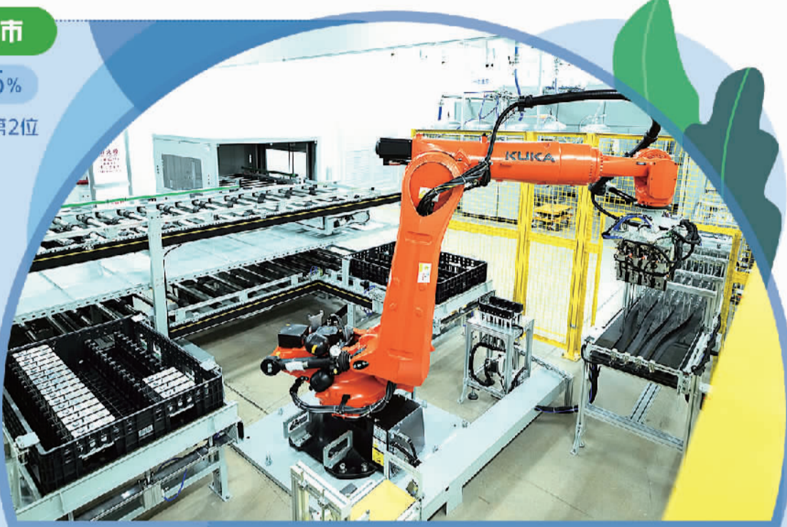
打造新能源产业发展新高地,楚能新能源孝感基地一期项目投产。