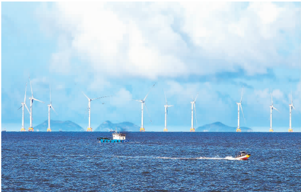
8月27日,在浙江省玉环市干江镇东面的隘湾湾海域上,华能玉环风电场22台大“风车”与渔船构成一幅渔电并进的画卷。近年来,玉环市全力推进风能资源的开发和利用,将风能资源转化为电能,并通过国家电网照亮千家万户。