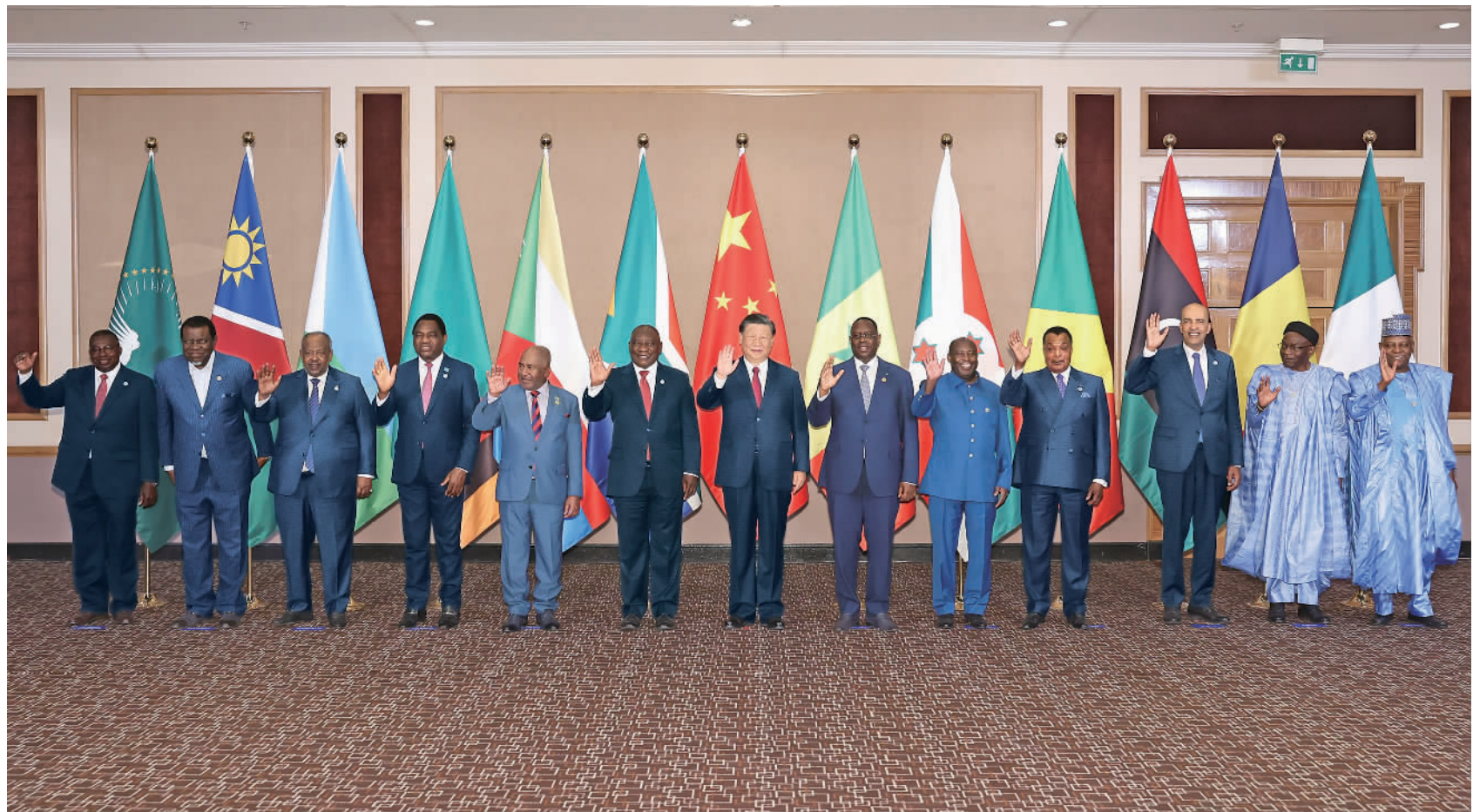
当地时间8月24日晚,国家主席习近平和南非总统拉马福萨在约翰内斯堡共同主持中非领导人对话会。