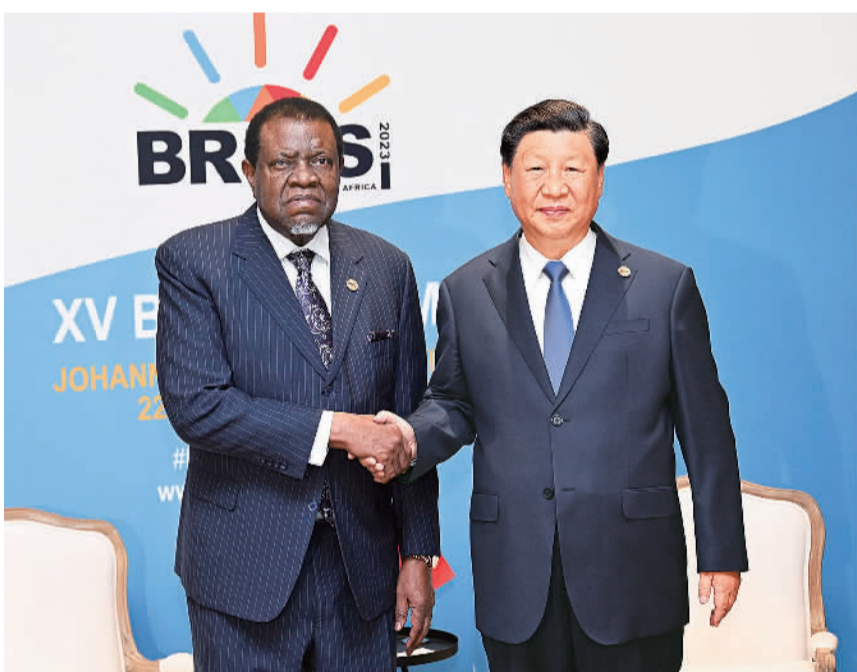
当地时间8月24日上午,国家主席习近平在约翰内斯堡出席金砖国家领导人会晤期间会见纳米比亚总统根哥布。

(上接第一版)感谢刚方在涉及中方核心利益问题上给予中方坚定支持,中方也将一如既往地坚定支持刚方(布)维护国家独立自主、反对外来干涉,支持刚方(布)在国际和地区事务中发挥更大作用。明年将迎来中刚建交60周年。中方愿同刚方共同规划、隆重庆祝,保持密切交往,增强政治互信,深化务实合作,推动两国全面战略合作伙伴关系取得更多成果。 萨苏表示,我对习近平主席2013年对刚果(布)进行的成功国事访问记忆犹新。中国企业承担了很多刚果(布)国家建设项目,同中国的友谊与合作是刚果(布)不断取得发展的重要因素。感谢中方给予刚方的宝贵支持和帮助。我对明年将迎来中刚建交60周年充满期待。希望双方以明年共同庆祝建交60周年为契机,推动刚中关系取得更大发展。刚方愿同中方深化在国际事务中的沟通协作,共同维护发展中国家利益。 蔡奇、王毅等参加会见。