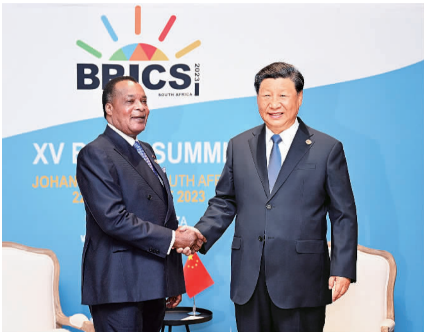
当地时间8月24日上午,国家主席习近平在约翰内斯堡出席金砖国家领导人会晤期间会见刚果(布)总统萨苏。