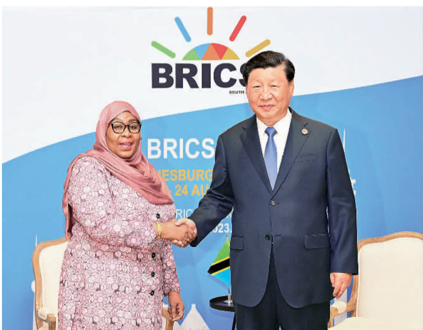
当地时间8月24日上午,国家主席习近平在约翰内斯堡出席金砖国家领导人会晤期间会见坦桑尼亚总统哈桑。

(上接第一版)新成员都是具重要影响力的国家,相信将对世界产生重大影响。中方愿同伊朗在金砖等多边平台上加强合作,推动多边主义健康强劲发展。 习近平指出,今年2月总统先生成功访华后,两国各部门抓紧落实我们达成的共识,取得积极成果。很高兴在中方及伊朗、沙特共同努力下,伊沙实现和解,促进了中东安全稳定。中方愿同伊方巩固友好,深化互信,在涉及彼此核心利益问题上继续相互支持,推动中伊全面战略伙伴关系取得更多成果。 莱希表示,伊方高度赞赏并感谢中方支持伊朗成为金砖正式成员,这为伊中关系发展提供了新动能,有利于两国加强在多边平台协作,也将有利于更好推进落实习近平主席提出的全球发展倡议、全球安全倡议、全球文明倡议。感谢习近平主席为推动伊沙对话和解发挥重要作用。金砖扩员表明,单边主义正在走下坡路。伊方深化伊中全面战略伙伴关系的决心坚定不移,愿同中方共同努力,进一步密切两国全面战略合作,积极推进共建“一带一路”合作。 蔡奇、王毅等参加会见。