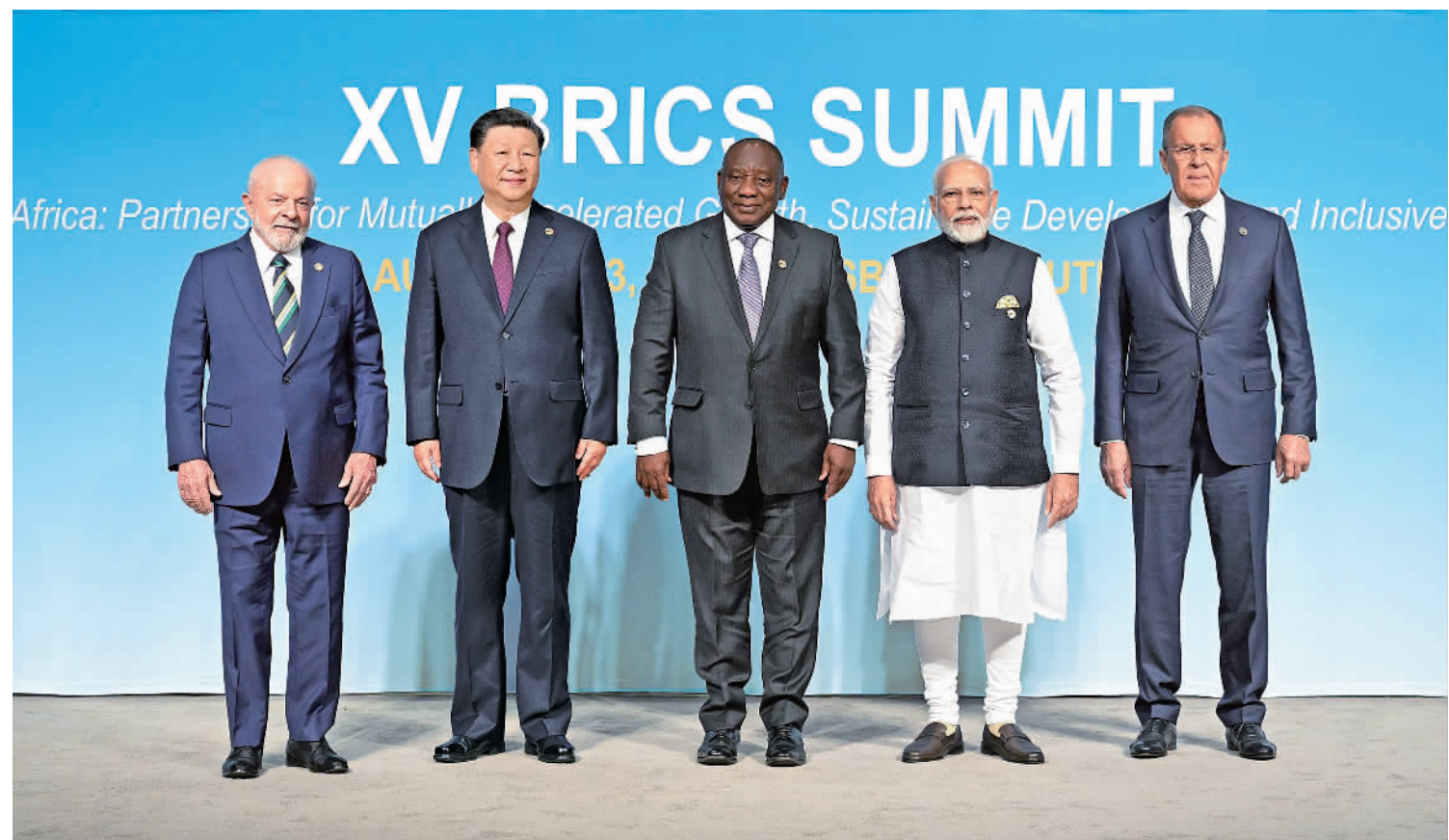
当地时间8月23日上午,金砖国家领导人第十五次会晤在约翰内斯堡杉藤会议中心举行。南非总统拉马福萨主持会议。中国国家主席习近平、巴西总统卢拉、印度总理莫迪和俄罗斯总统普京(线上)出席。习近平发表题为《团结协作谋发展 勇于担当促和平》的重要讲话。