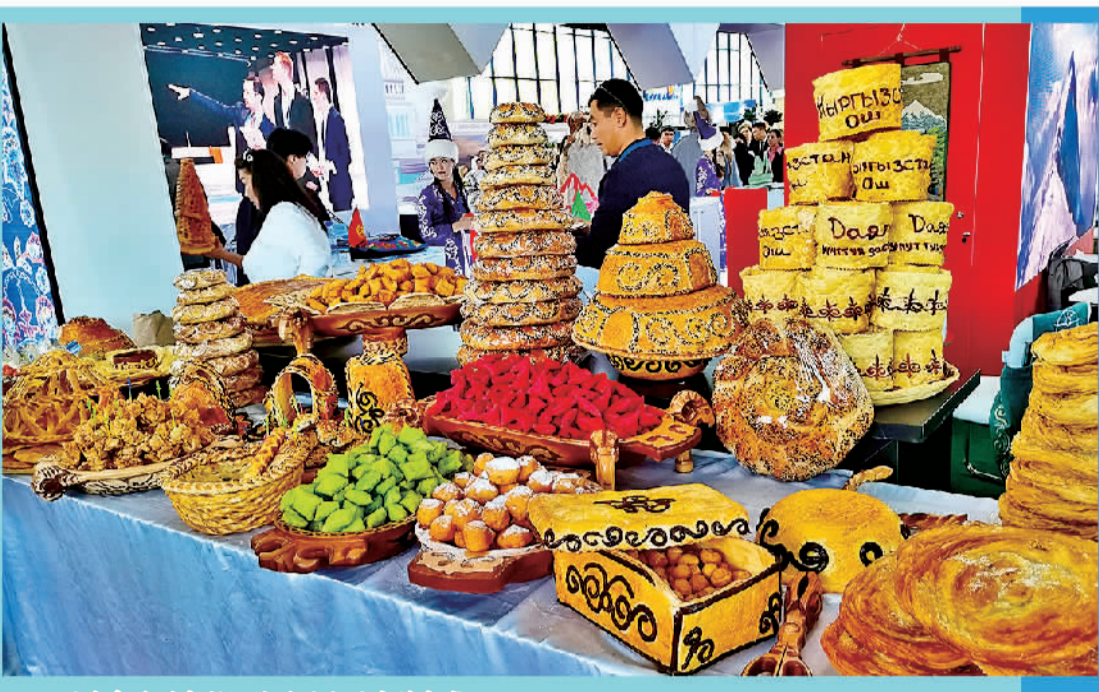
图为乌兹别克斯坦旅游展上展出的各式烤馕和传统面包。

乌兹别克斯坦经济研究与改革中心的调查显示,该国上半年商业环境明显改善,商业景气指标不断接近近年来的高点。超过73%的企业家预计未来3个月整体经营状况将有所改善。