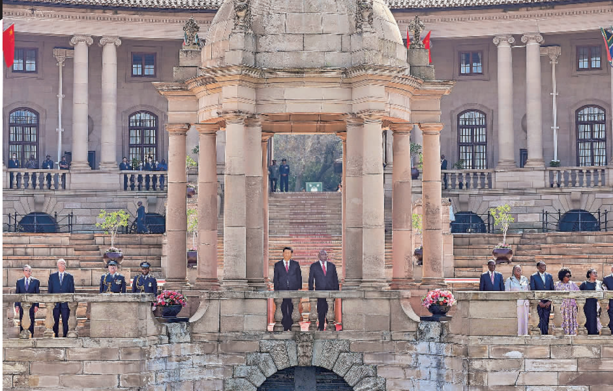
当地时间8月22日上午,正在南非进行国事访问的国家主席习近平在比勒陀利亚总统府同南非总统拉马福萨会谈。会谈前,拉马福萨在总统府广场为习近平举行欢迎仪式。