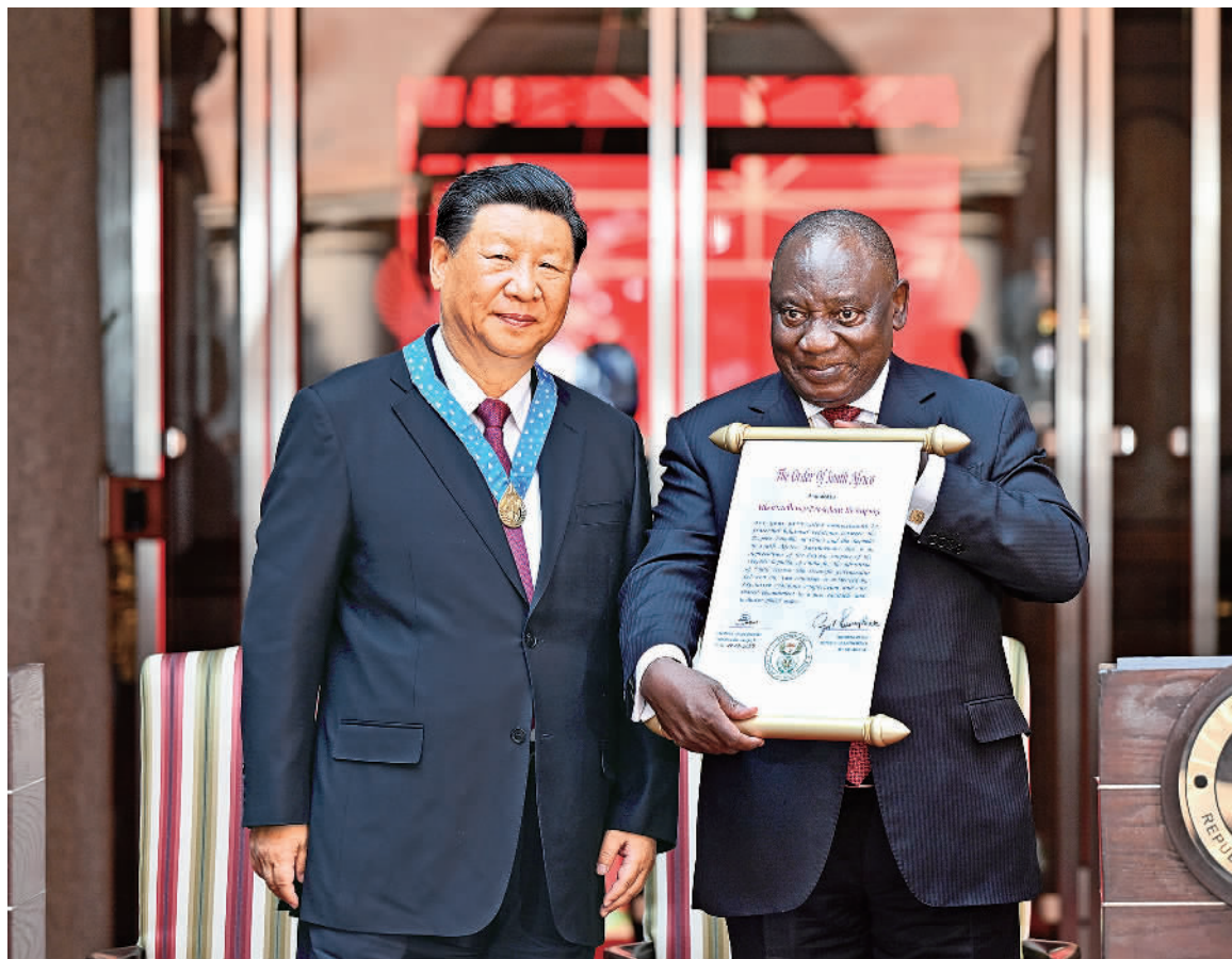
当地时间8月22日上午,正在南非进行国事访问的国家主席习近平在比勒陀利亚总统府同南非总统拉马福萨会谈。会谈后,拉马福萨向习近平授予“南非勋章”,这是南非授予重要友好国家元首的最高级别勋章和最高荣誉。