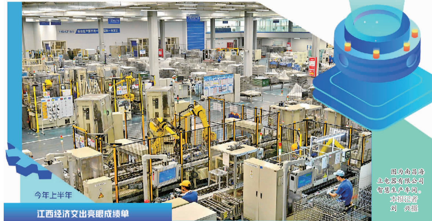
图为南昌海立电器有限公司智慧生产车间。