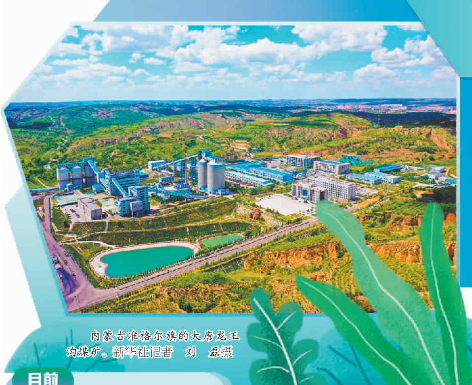
内蒙古准格尔旗的大唐龙王沟煤矿。新华社记者 刘 磊 摄

国能准能集团党委书记、董事长杜善周表示,生态优先、绿色发展是资源型企业转型发展的必由之路。集团在创新形成黄土高原生态建设技术体系的基础上,开拓“生态+”多元产业体系,建设矿山博物馆、生物