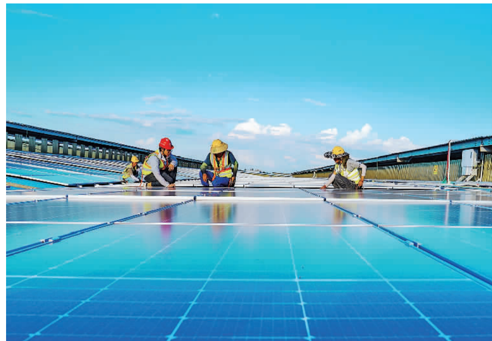
8月10日，中铁十五局集团电气化公司江西新钢联天公司厂房屋顶分布式光伏发电项目施工现场，施工人员正在安装光伏板。近年来，江西省聚焦“双碳”目标，推动能源低碳转型。今年上半年，江西新能源装机新增346万千瓦。

推动龙头企业为做大特色产业起到引导和示范作用。广西累计培育市级以上农业产业化重点龙头企业1733家、农民专业合作社6.3万家、家庭农场12.3万户、农业产业化联合体305个。通过这些新型农业经营主体，可以有效带动引领特色产业协同发展。要积极引导农业龙头企业担任“链主”建设全产业链，支持农民专业合作社健全组织机构，提供统一的社会化服务，扶持一批资源要素共享、联农带农紧密的农业产业化联合体，通过各方面共同努力一起做大做强特色产业。