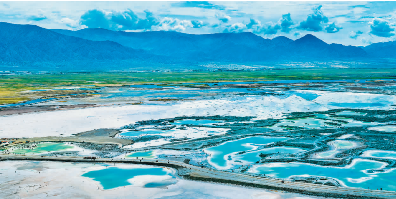
8月4日,青海省海西蒙古族藏族自治州大柴旦翡翠湖,形态迥异、深浅不一的盐湖湖水清澈湛蓝,在阳光照耀下宛如一块块晶莹剔透的宝石,吸引游客前来观光游玩。近年来,青海加快打造国际生态旅游目的地,不断推进旅游产业化与生态环境改善齐头并进。

“下一步,在不影响国家自主贡献目标的前提下,积极推动国际组织的绿色消费、碳减排体系与国内绿证衔接,推动以国内绿证作为中国出口型企业消费使用绿色电力的有效凭证,提升我国绿证在国际层面的认可度和权威性,为我国产品出口提供有力保障。同时,加强与相关国际组织的沟通合作,积极推动绿证核发、计量、交易等相关国际标准的研究制定,提高我国在绿色电力消费领域的国际话语权和影响力。”魏青山说。