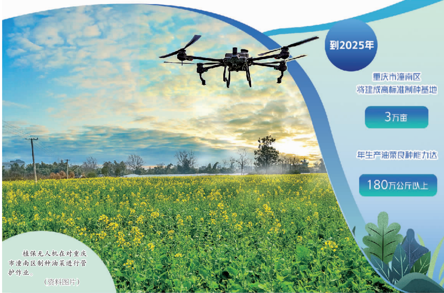
植保无人机在对重庆市潼南区制种油菜进行管护作业。(资料图片)