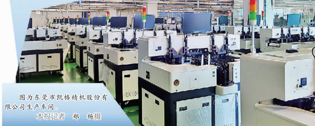
图为东莞市凯格精机股份有限公司生产车间。

广东电子信息产业规模连续32年居全国第一 家电制造业营收规模占全国比重超40% 汽车工业销售产值破万亿元