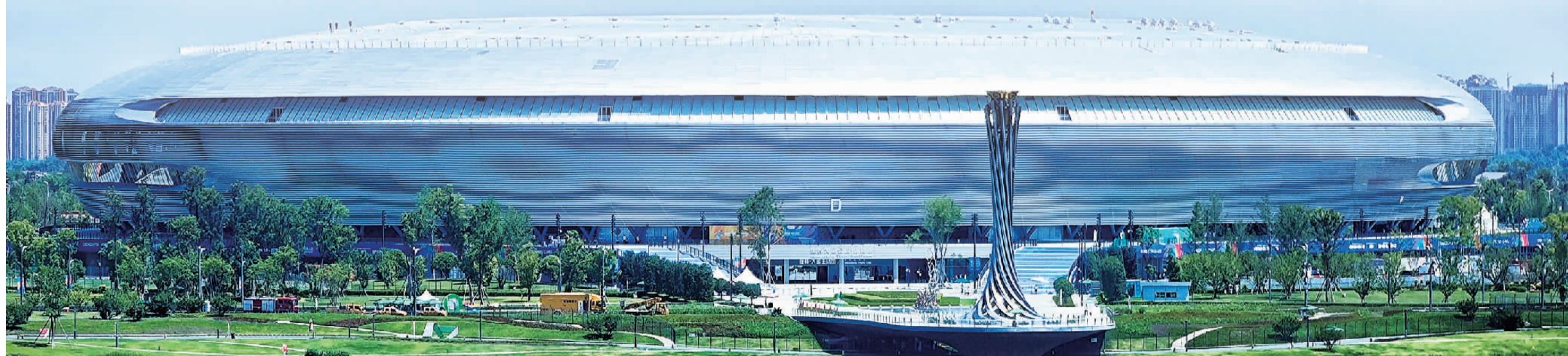
图为第31届世界大学生夏季运动会开幕式举办地东安湖体育公园的立体育场。