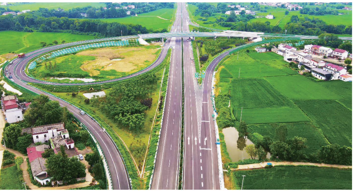
7月26日,在安徽省安庆市潜山市源潭镇,建设中的无(为)岳(西)高速路面六标段雏形初显。该高速有望今年建成通车。通车后,将进一步完善长江经济带综合立体交通走廊。近年来,当地不断加大交通基础设施建设,方便群众出行,为推进产业发展夯实基础。

需要注意的是,由于贷款合同变更、贷款置换涉及商业银行的自主经营权,具体事项仍需借款人与商业银行在合法合规的前提下协商一致。“银行尤其是国有大行意识到,降低存量房贷利率是一个当下痛苦、长远有利的选择。”董希淼说,提前还款、降低存量房贷利率都会影响银行收益,但从长远看,后者有助于增强客户黏性、稳定存量客户。“接下来,金融部门将积极配合有关部门加强政策研究,因城施策提高政策精准度,更好支持刚性和改善性住房需求,促进房地产市场平稳健康发展。”邹澜说,人民银行将深入贯彻落实党中央、国务院决策部署,坚持“房住不炒”定位,配合相关部门和地方政府扎实做好保交楼、保民生、保稳定工作,满足行业合理融资需求,继续为行业风险有序出清创造有利金融环境。