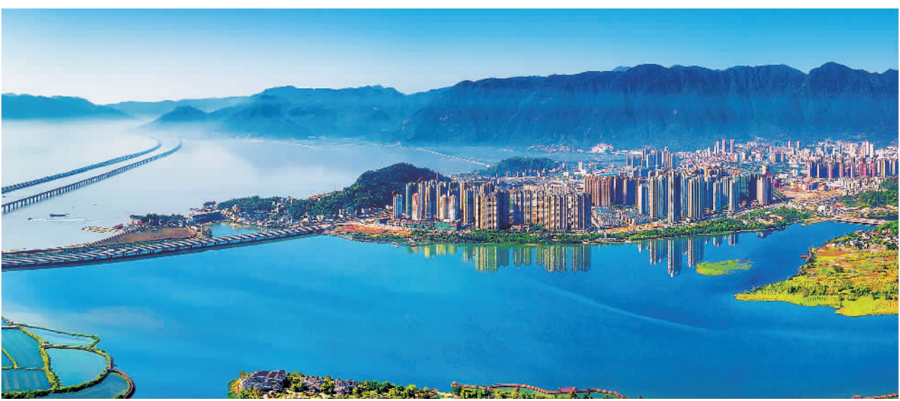
下图 福建省宁德市城区一隅。(资料图片)

“5个10倍增长”反映出宁德科技创新投入的力度:研发投入从2012年的7.85亿元增长到2021年的77.01亿元;国家级高新技术企业数量从2012年的22家增长到2022年的227家;研发平台数量从2012年的16家增长到2022年的167家;高技术产业增加值占规模以上工业增加值比重从2012年的不到5%增长到2022年的54.2%;人才经费10年间实现10倍速度增长。(下转第十版)