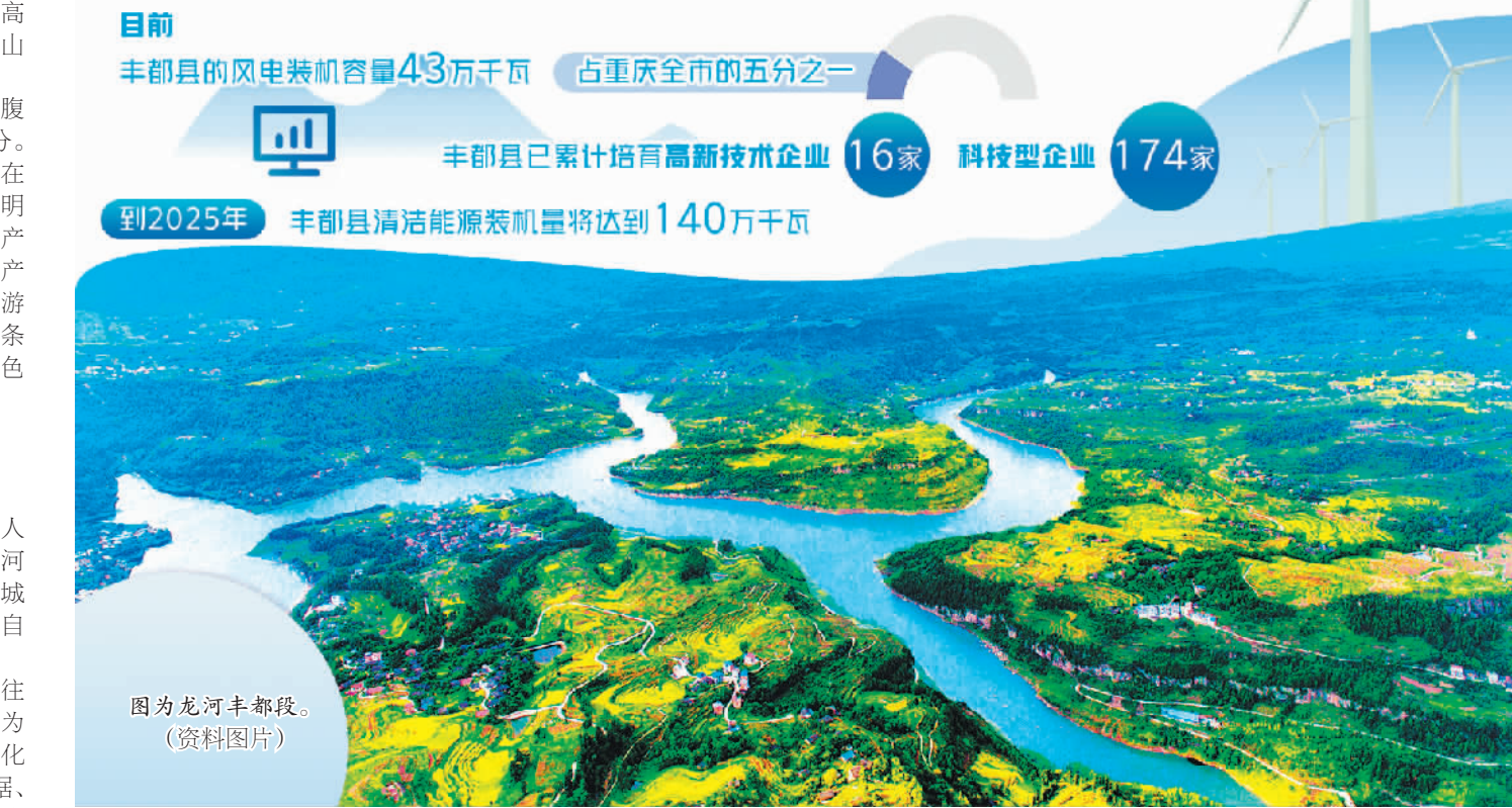
图为龙河丰都段。(资料图片)

在丰都县兴义镇保家寺村，当地利用数字孪生、新型储能等新技术对电网设备进行改造，打造了“光伏+储能+养殖”一体化项目。记者在采访时看到，占地30多亩的保家寺智能化生猪养殖场铺设了60千瓦光伏设施，不远处配置了1套储能装置。