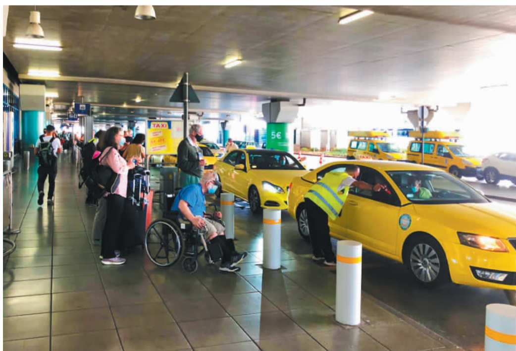
旅客在雅典国际机场外排队乘坐出租车。