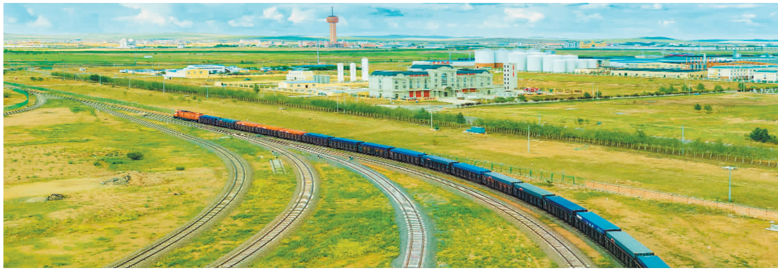
7月13日，一列满载55辆集装箱的X8102次回程中欧班列，在内蒙古自治区呼伦贝尔市满洲里铁路口岸集装箱场换装完毕，集结待发。今年上半年，满洲里站完成进出口运量1009.3万吨，同比增长46.1%，创历史新高。

成效的“金标准”。二是注重因地制宜，坚持“因城施策、一圈一策”，分级分类进行便民生活圈建设，发展“一店一早”，补齐“一菜一修”，服务“一老一小”，助力提高居民生活品质。三是注重统筹协调，将便民生活圈建设与其他社区工作相衔接，形成工作合力。